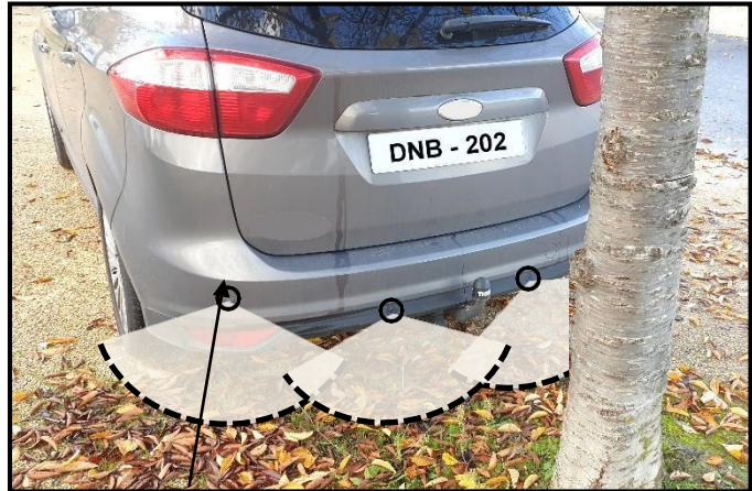
Capteur à ultrasons

Il est constitué de 4 capteurs à ultrasons positionnés sur le pare-chocs du véhicule. Lorsqu'un obstacle est détecté (mur, véhicule, arbre, personne...) ( voir Document 1 ), le système émet des bips sonores et affiche la position de l'obstacle sur un écran au tableau de bord.